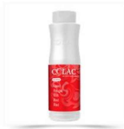
Farvestof - Rød