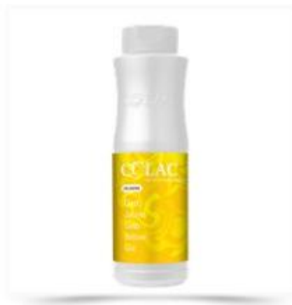
Farvestof - Gul