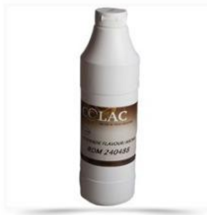
Smagsstof - Rom