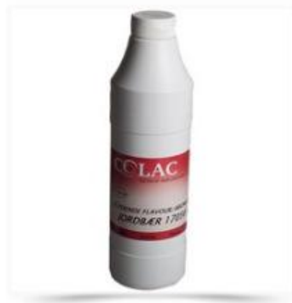
Smagsstof - Jordbær