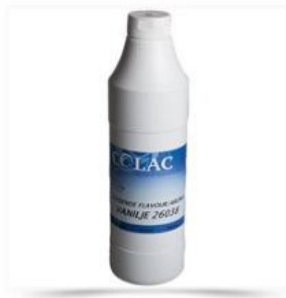
Smagsstof - Vanilje