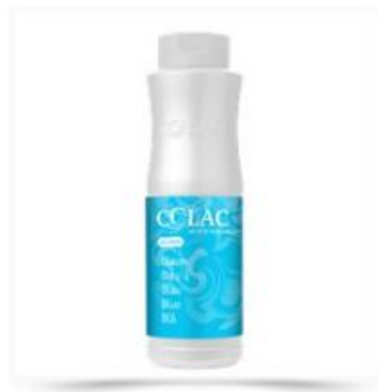
Farvestof - Blå