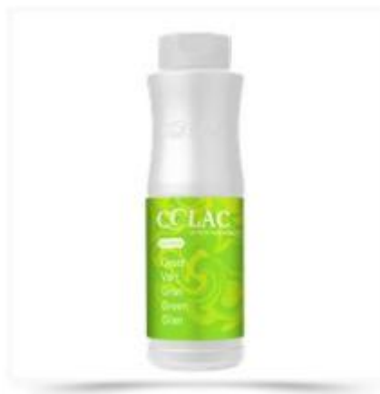
Farvestof - Grøn